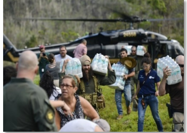
Aduana de Estados Unidos y personal de FEMA entregan comida y agua a los residentes aislados de Puerto Rico luego de que su puente fue destruido por el Huracán Maria en las montañas alrededor de Utuado, Puerto Rico.